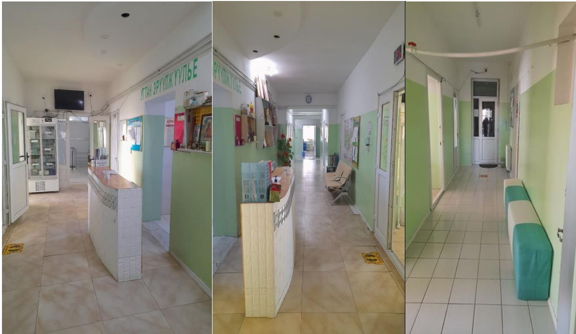
Сувилагчийн пост, коридор