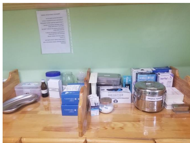
Түргэвчилсэн 6 төрлөөр хийж байна