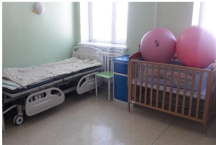
Төрсний дараах өрөө