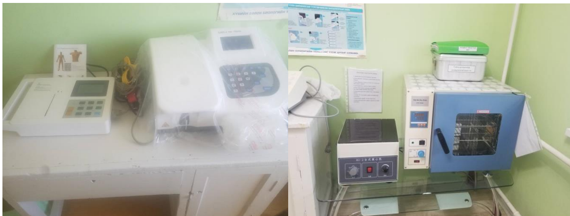
Цус биохимийн хагас анализатор